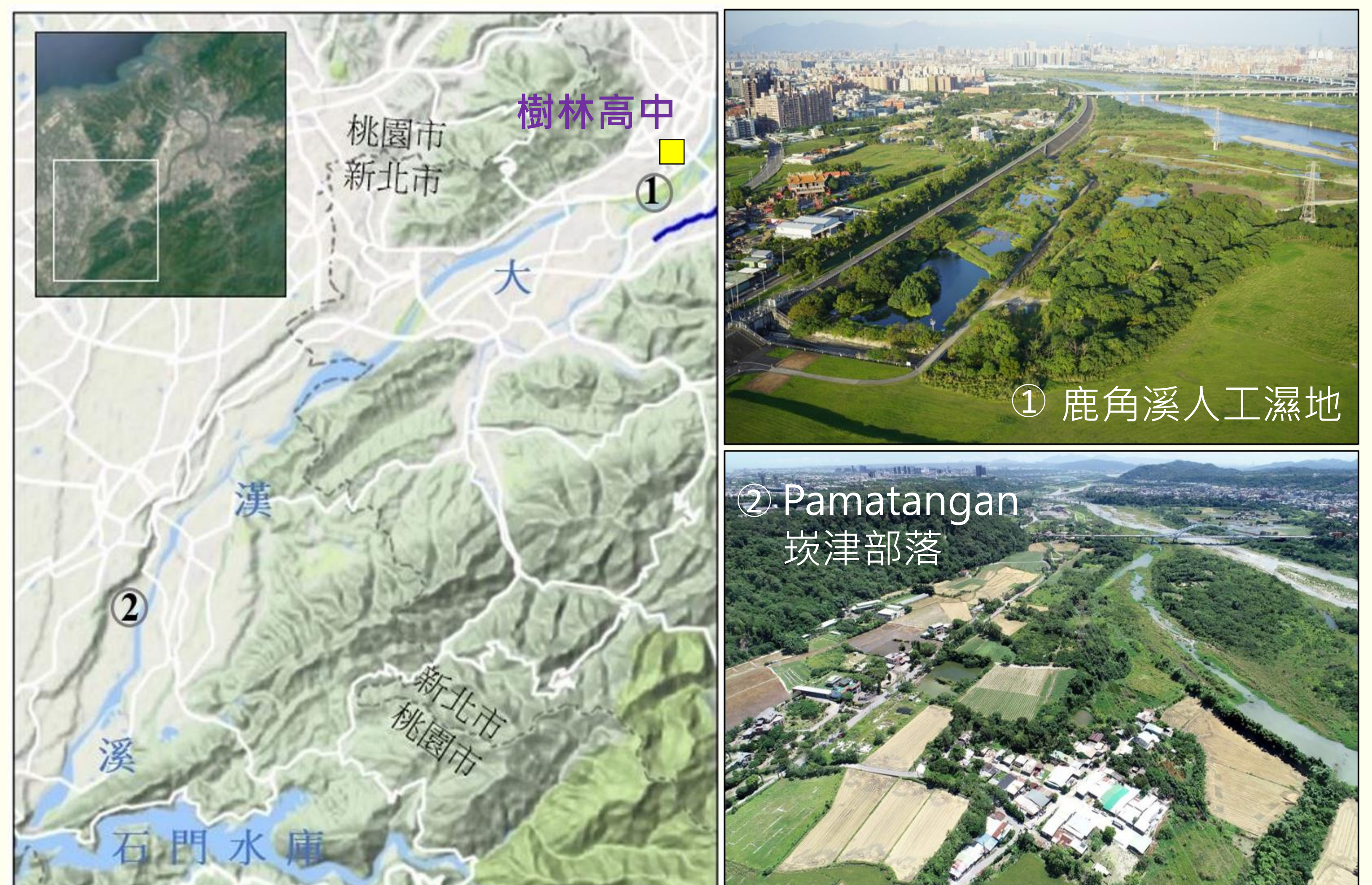
圖2：樹林高中與本課程戶外學習場域的位置