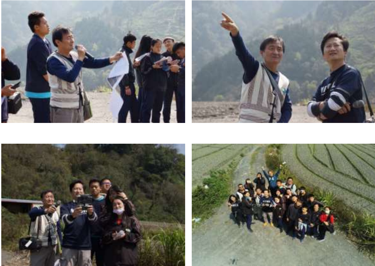
圖6、宜蘭縣大同國中3月20日課程花絮

除了正射影像鑲嵌圖及三維數值地表模型之外，為讓虛擬原鄉能夠有更沉浸式的體驗，本計畫也利用Ricoh Theta V全景相機，在大同國中內幾處重要地點拍攝360°全景影像，如圖7所示。後續會透過Unity軟體製作沉浸式虛擬實境，使用者可以透過簡易的Cardboard裝置或高階的虛擬實境眼鏡，完全進入虛擬實境的世界，猶如漫步於虛擬原鄉之中。