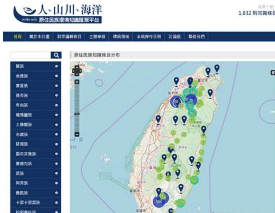
圖 1、原住民族環境知識匯聚平台

本團隊前期以自發性地理資訊 (Volunteered Geographic Information, VGI) 之概念建構了一套「人、山川、海洋 - 原住民族環境知識匯聚平台」( http://iknowledge.tw )，如圖 1 所示。此一知識平台翻轉了過去由上而下的權威編纂方式，而是開放給所有人都可以編輯，讓每一位原住民族人作為主動的知識提供者，由下而上地累積成原住民族地理環境知識庫，以確保知識條目之在地性與原住民族主體性。而平台採用多語系設計，因此可以讓各族族人以族語來編輯自己的環境知識，一方面可以保存族語文化，另一方面也能避免知識條目因翻譯過程而喪失原意，而同一知識條目也可以透過切換族語來作不同族群之間的知識參照。截至 108 年 5 月 1 日止，已有 389 位使用者註冊帳戶，累積 1832 條原住民族環境知識條目。