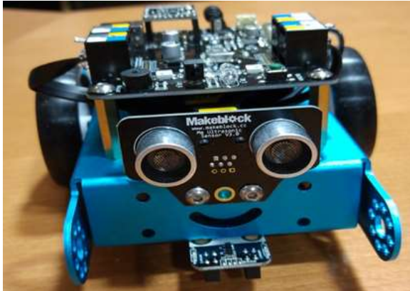
M bot 機器人