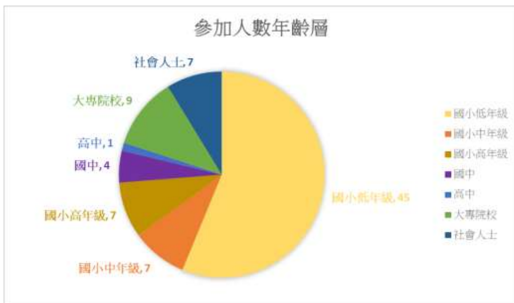
圖 5 參加闖關活動人數統計