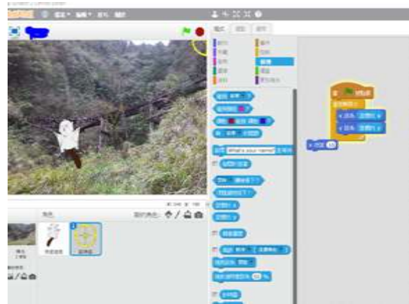
學生作品：獵飛鼠小遊戲