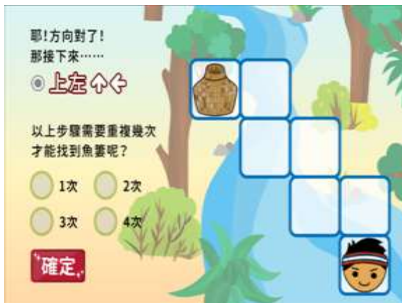
找寶藏遊戲：迴圈概念應用