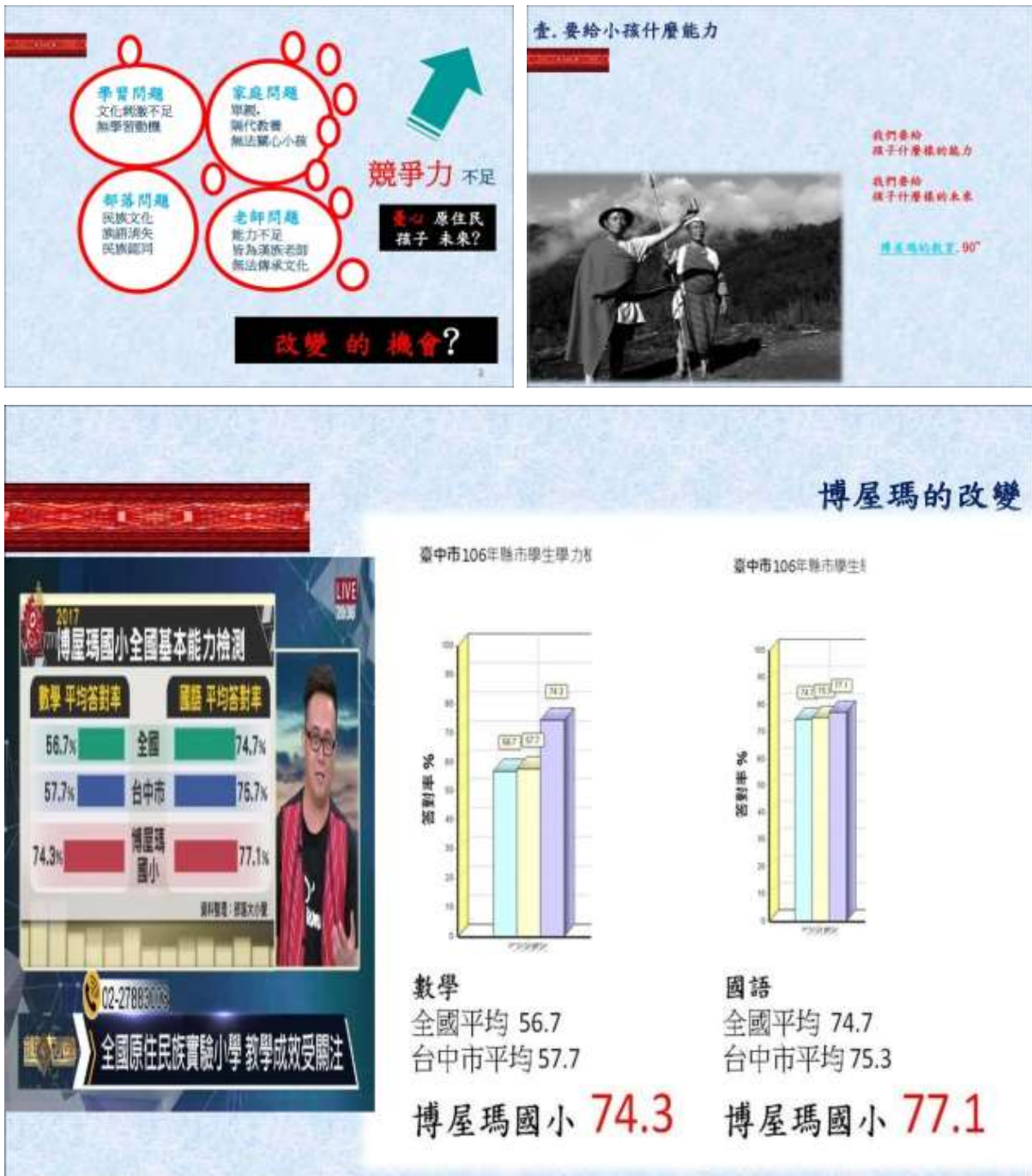
圖 2、博屋瑪國小教育成效