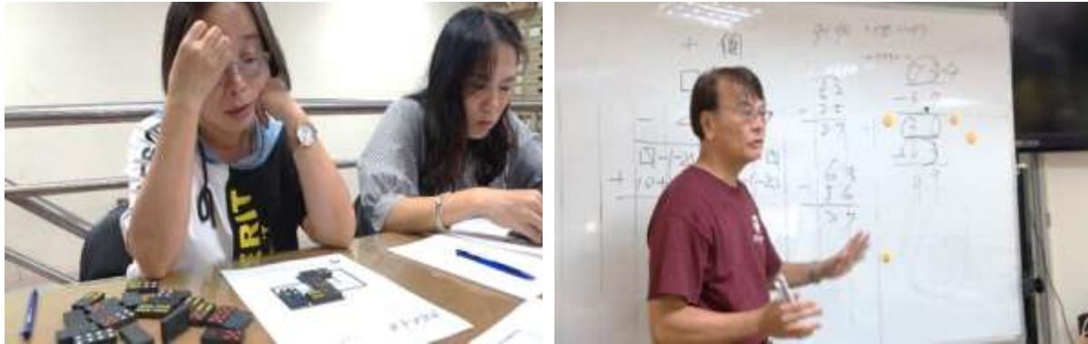
圖 6、博屋瑪國小教師專業發展研習——骨牌排列