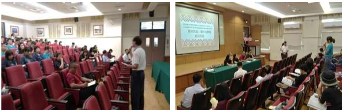
圖 4、科技部計畫推廣研習暨西區中心八月成果展實況