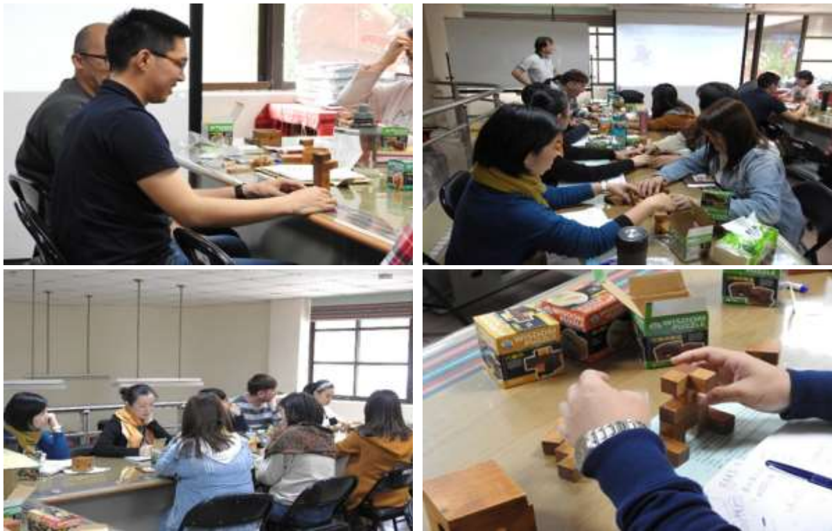
圖 5、博屋瑪國小教師專業發展研習—索瑪立方塊