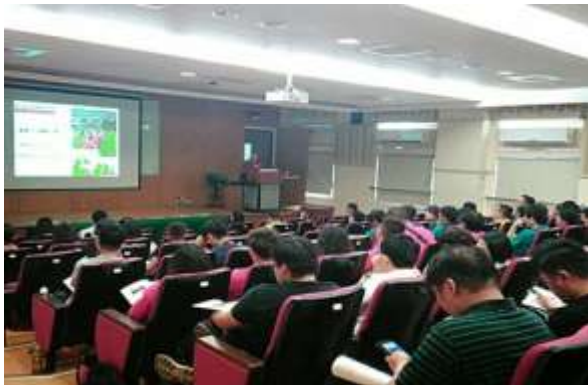
圖 3、博屋瑪國小課程發展